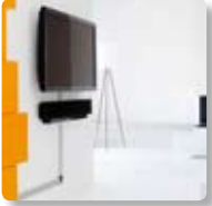
Göm kablarna. SMS Cable Management.

Tillbehör: SMS Cable Management (sid 6:01)